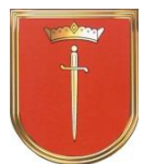
Miasto i Gmina Krzanowice