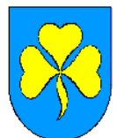
Gmina Pietrowice Wielkie