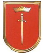
Miasto i Gmina Krzanowice