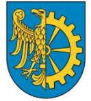
Miasto i Gmina Kuźnia Raciborska