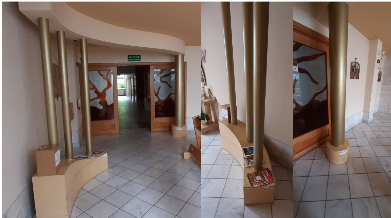
Zdjęcie 1: Zabudowa do renowacji